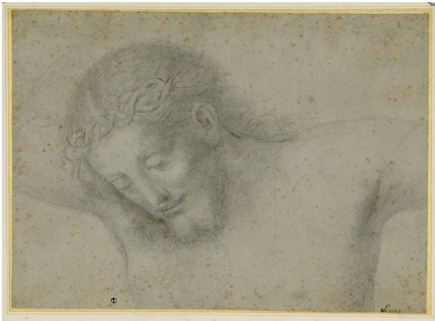
6. Bernardino Lanino, Testa del Cristo crocifisso , circa 1550, matita nera su carta azzurra, 325 x 445 mm. Torino, Musei Reali, Biblioteca Reale, 14649 S.M.

me al disegno gemello all'Albertina di Vienna, propone lo studio delle quattro figure dipinte da Lanino ai due lati del finestrone rotondo nella parte alta della parete di fondo della cappella presbiteriale di Legnano 16 . Trattandosi appunto della parte alta, normalmente eseguita per prima, ci si può spingere a ritenere che le figure in questione fossero già dipinte al momento del primo pagamento che abbiamo ricordato e che quindi la datazione del disegno si possa stringere al 1560-1562. La medesima conduzione tecnica e stilistica sembra corrispondere anche a un altro disegno laniniano della Reale, raffigurante Sant'Eusebio tra santi francescani e donatori (fig. 5), dalla iconografia composta e cadenzata, una modalità che appare essere una costante delle opere di Lanino in questi anni, al punto che ne è stata autorevolmente evocata la corrispondenza con talune scelte condotte anche da Giuseppe Giovenone il giovane oppure, per rimanere alla produzione di Lanino, con un dipinto come la Madonna 'del