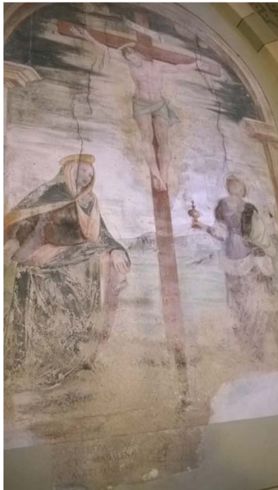
7. Bottega della famiglia Lanino, Crocifissione di Cristo con la Madonna e santa Maria Maddalena , circa 1580-1585, dipinto murale. Confienza, Madonna del Carmine

Proprio il gioco delle relazioni tra le diverse versioni di Crocifissione ci permette poi di giungere a riconoscere che invece alcune caratteristiche del foglio del Museo Civico si sono conservate più riconoscibili in un problematico affresco nella chiesa della Madonna del Carmine a Confienza (fig. 7). Qui, in un momento che va collocato forse già negli anni ottanta, i collaboratori di bottega recuperano