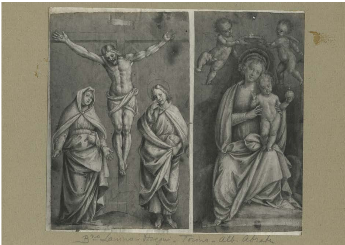
2. Due disegni dall'Album Abrate. Torino, Archivio Fotografico della Fondazione Torino Musei, fondo Rovere, scat. 21

gno descritto da Rodolfo con il n. 8), che era stata identificata con l'opera passata in seguito alla collezione Meissner di Zurigo 5 .