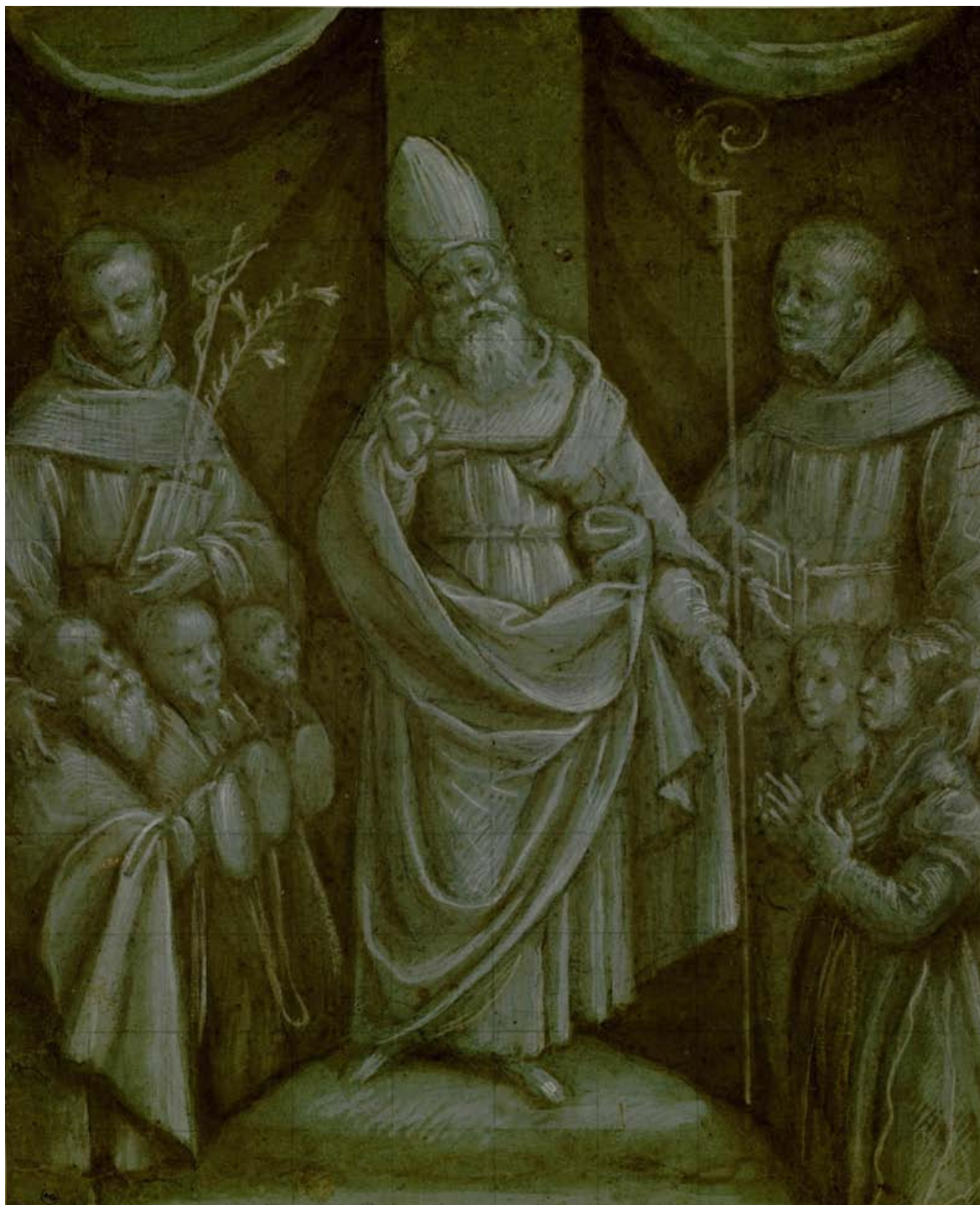
5. Bernardino Lanino, Sant'Eusebio tra santi francescani e donatori , 1560-circa 1565, pennello, biacca e acquerello ocra su carta azzurra, 410 x 326 mm. Torino, Musei Reali, Biblioteca Reale, inv. 14641 S.M.

all'intero arco della sua lunga carriera. È però possibile, in qualche caso, individuare punti di riferimento cronologici certi, come avviene ad esempio per il Cristo che mostra le piaghe ora citato, che è ben riconoscibile come uno degli studi che l'artista aveva sviluppato nel corso della realizzazione degli affreschi del presbiterio di San Magno a Legnano. Per questo impegnativo cantiere, abbiamo indicazioni di data precise e sicure: il contratto relativo fu stipu-