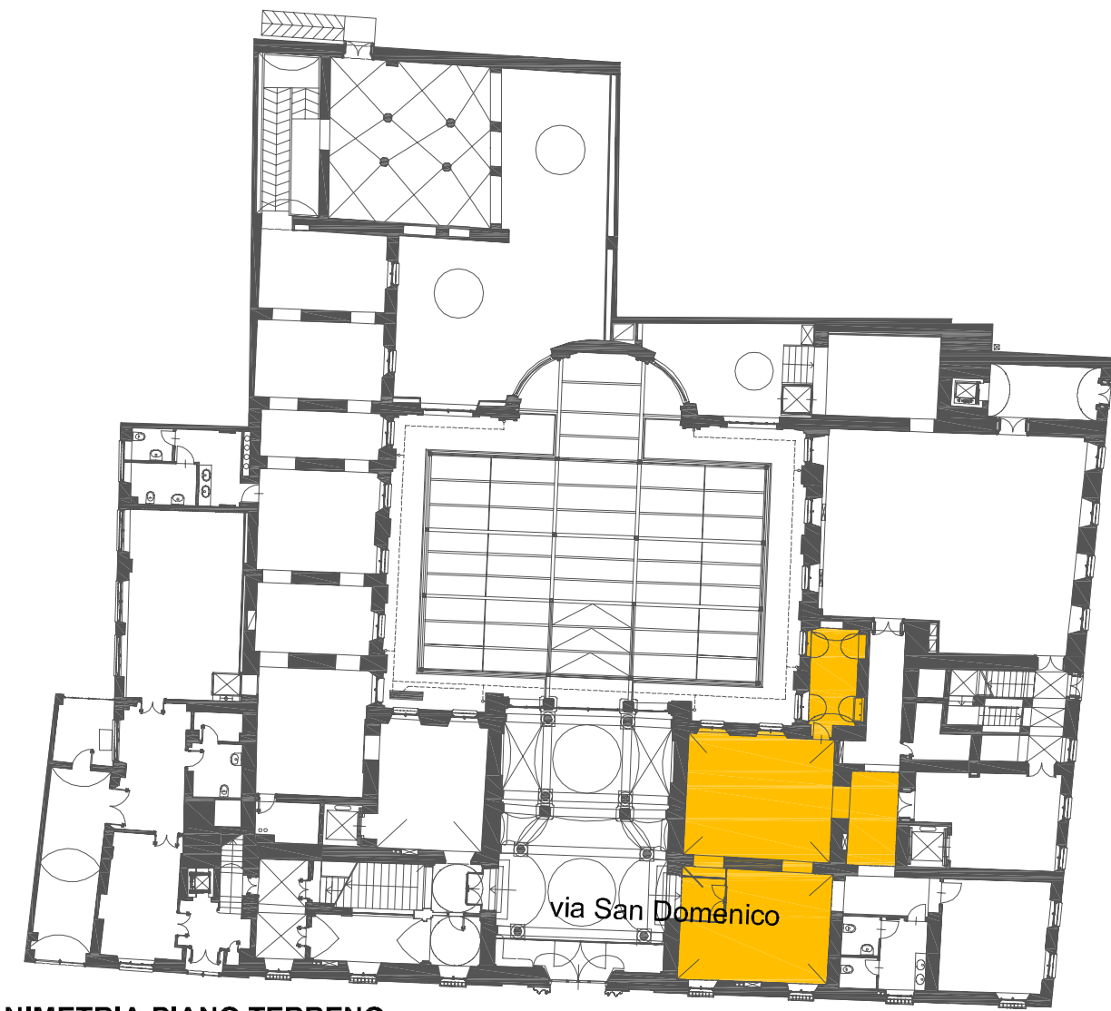
PANIMETRIA PIANO TERRENO