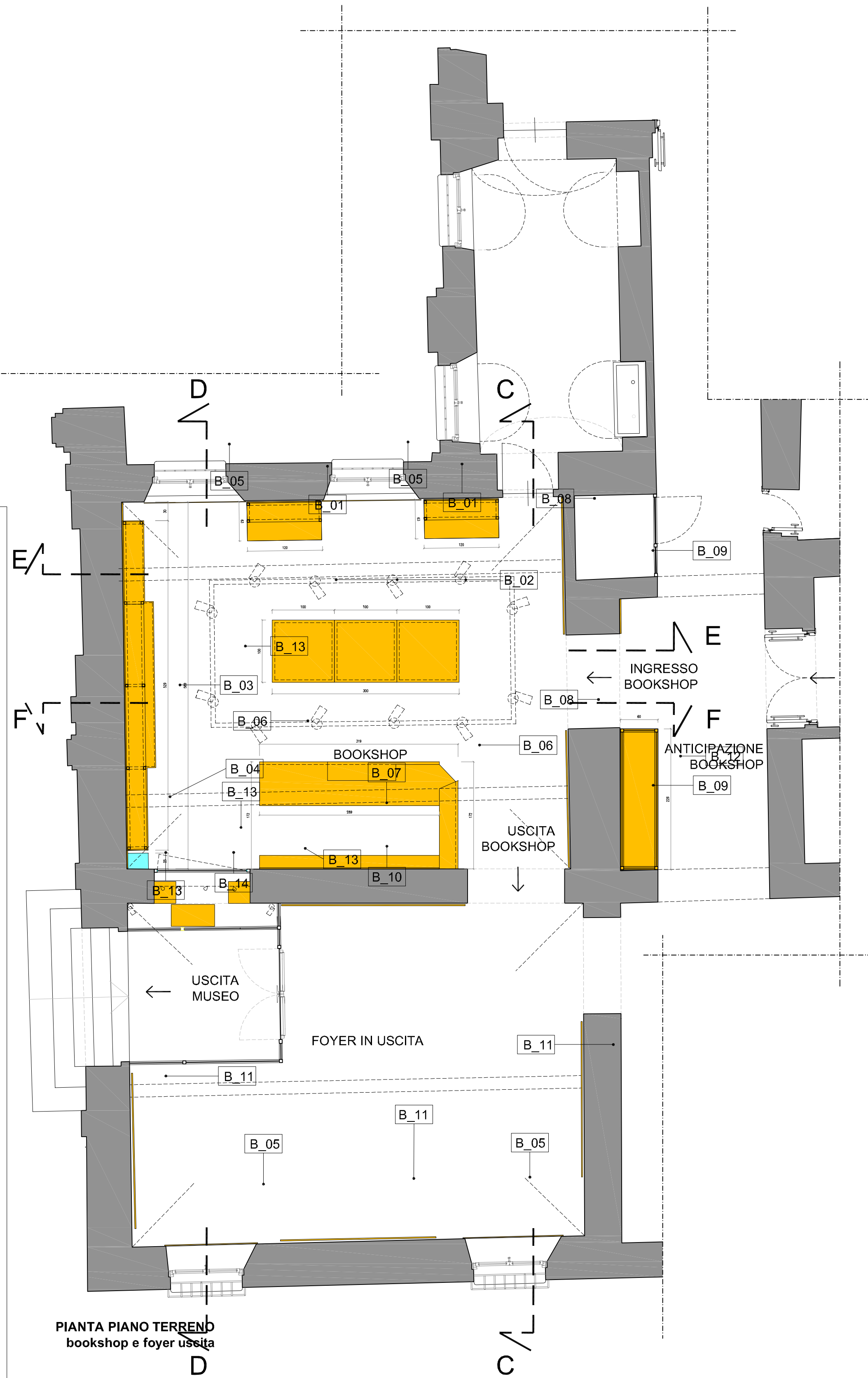
PIANTA PIANO TERRENO bookshop e foyer uscita